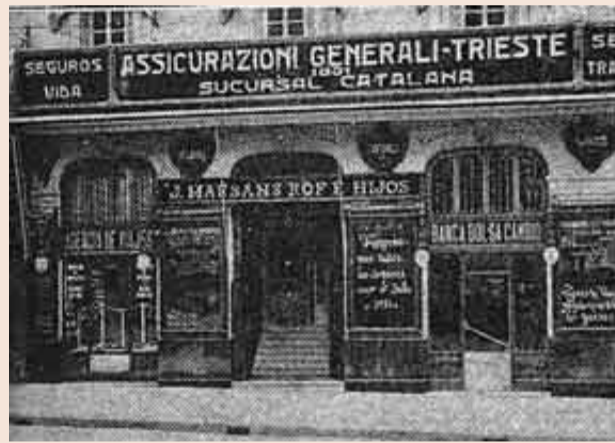
Viajes Marsans nació en La Rambla de Canaletas en 1910.

La agencia de Las Ramblas ha aguantado los cambios de manos del grupo, que en 1964 pasó a titularidad pública y en 1985 fue absorbida por Trapsa, empresa de transportes