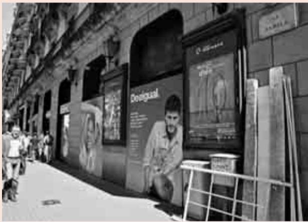
El antiguo Marsans era vecino de Desigual, que amplía su tienda.

Desde este local de Las Ramblas, Viajes Marsans creció gracias al incipiente turismo extranjero en España. Su po aprovechar la conexión de