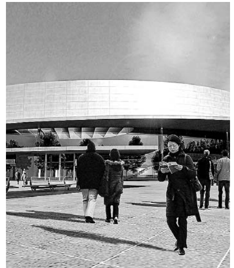
La estación intermodal tendrá un gran edificio central.

El Departament de Política Territorial sacó ayer a concurso las obras para la construcción de la futura estación intermodal de El Prat por 80 millones de euros. El proyecto se ejecutará en 34 meses y se completará con un aparcamiento para 604 vehículos.